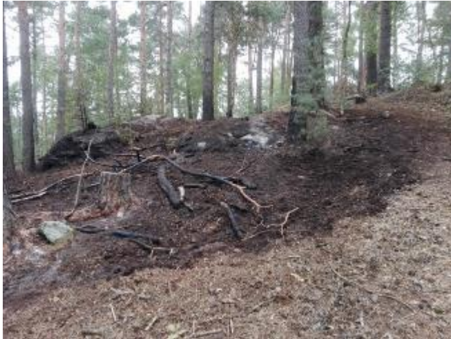
Abbildung 1: Waldbrand (Mittelbrand) am 06.10.2018 auf dem Hochplateau des „Stein-Berg“ in der Paulsdorfer Heide.

Bäume befestigen mit ihren tiefen Wurzeln den Boden – sie halten buchstäblich die Erde fest. Der Wald schützt somit den Boden vor Erosion, also davor, dass er bei heftigen Regengüssen weggeschwemmt wird. Werden Bodenbedeckung wie Laub sowie Humus und Pflanzenwurzeln bei einem Waldbrand zerstört, steigt die Gefahr, dass der Boden destabilisiert wird. Ebenso gefährlich kann die Asche, die nach dem Feuer entstanden ist, werden. Weil sie wasserabstoßend ist, kann Regenwasser kaum in den Boden versickern, sondern nur oberflächlich abfließen. In Bergregionen können bei starkem Regen Erosionen so dazu führen, dass Steine, große Mengen Erde oder gar Lawinen beziehungsweise ganze Hänge ins Tal rutschen. Wie die Ascheschicht nach einem Waldbrand zu einem erhöhten Risiko für Schlammlawinen führen kann, verdeutlicht das folgende Experiment.