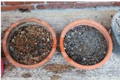
In der Schale mit Asche sieht man recht schnell, dass das Wasser zwar anfangs versickert, sich jedoch eine feste, später hydrophobe Schicht bildet.