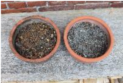
Links normale Erde, rechts mit Ascheauflage