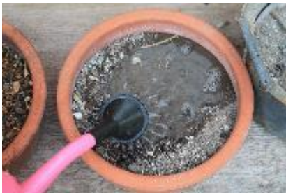
Wässern der Schalen