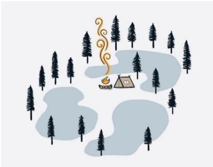
Abbildung 1: Comiczeichnung zum Thema Campen mit Lagerfeuer im Wald Grafik: Piyapong Saydaung | pixabay