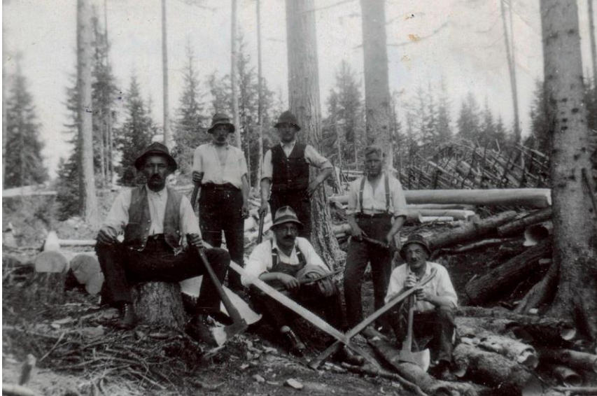
Abbildung 1: Waldarbeit mit Axt und Säge