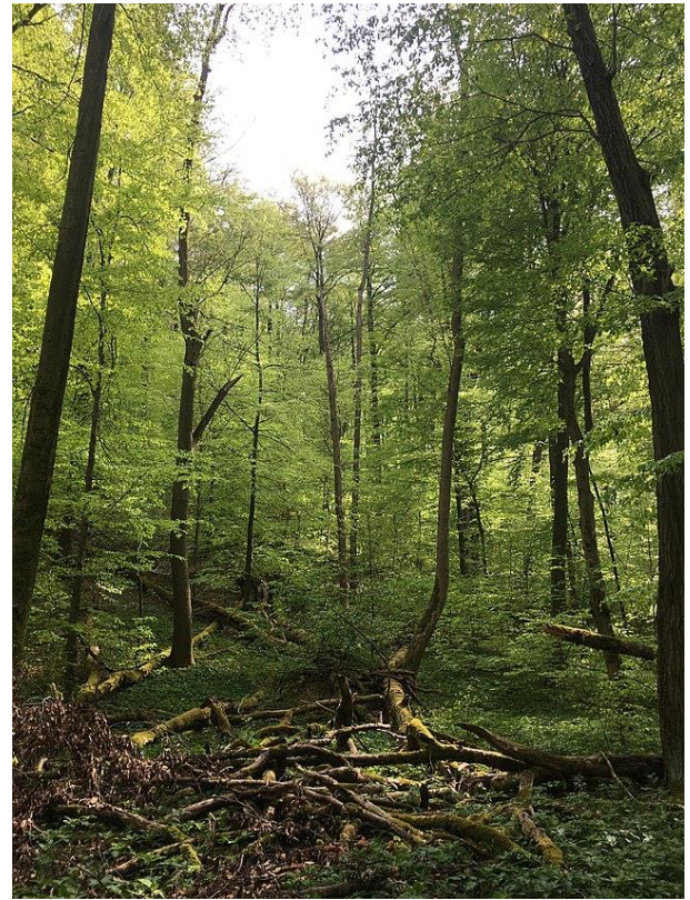
Abbildung 4: Nationalpark Hainich, Deutschland