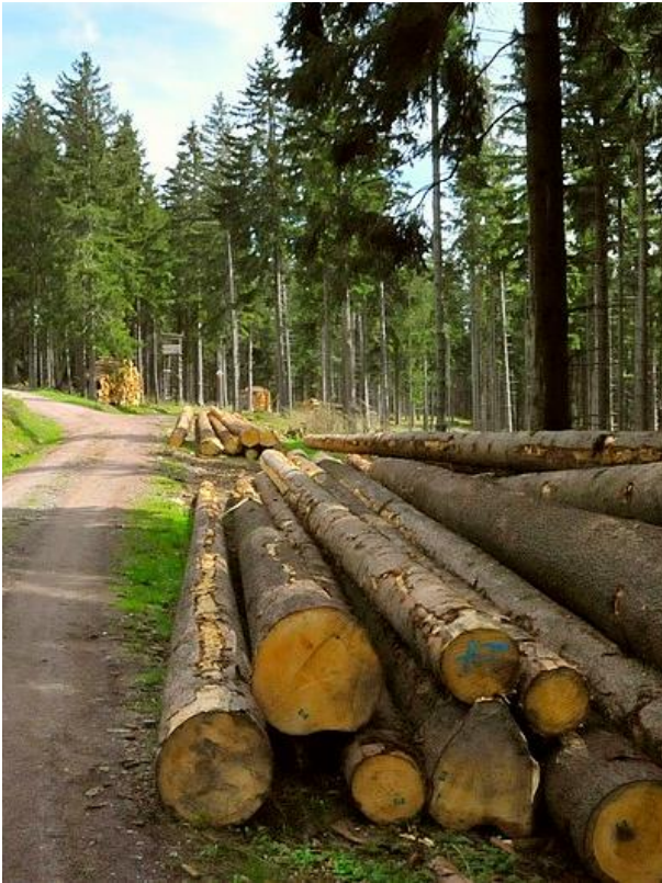
Abbildung 4: Gefällte Fichten im Thüringer Wald, Deutschland