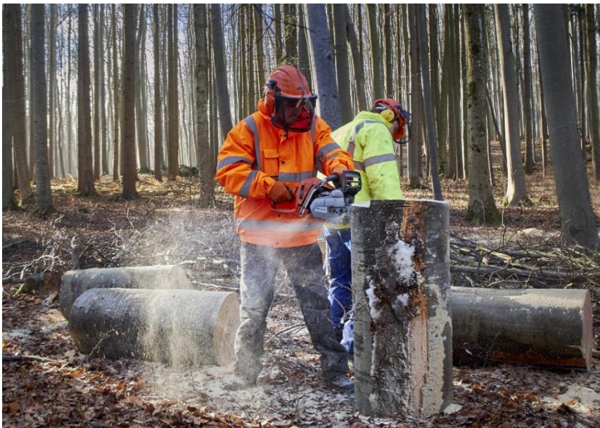
Abbildung 2: Waldarbeiter mit Motorsäge