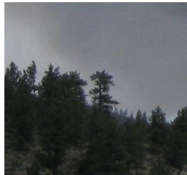
Abbildung 7: U.S. Department of Agriculture / Flickr