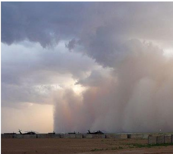
Abbildung 10: