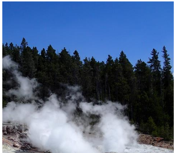
Abbildung 9: James St. John / Flickr