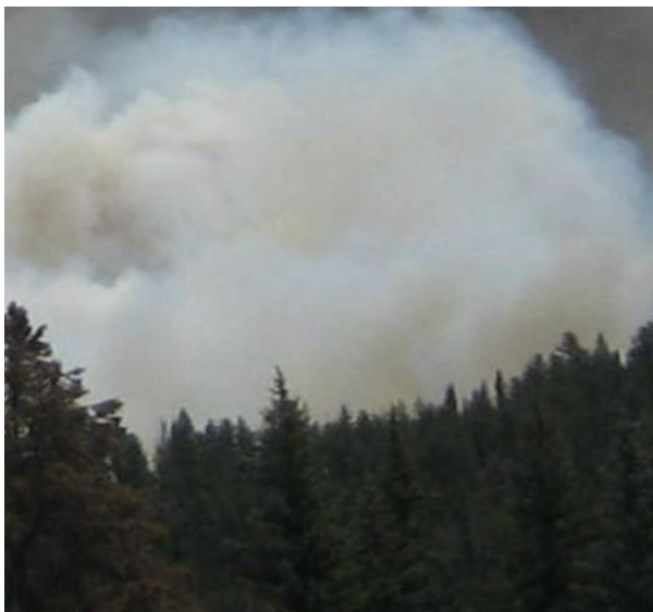
Abbildung 6: