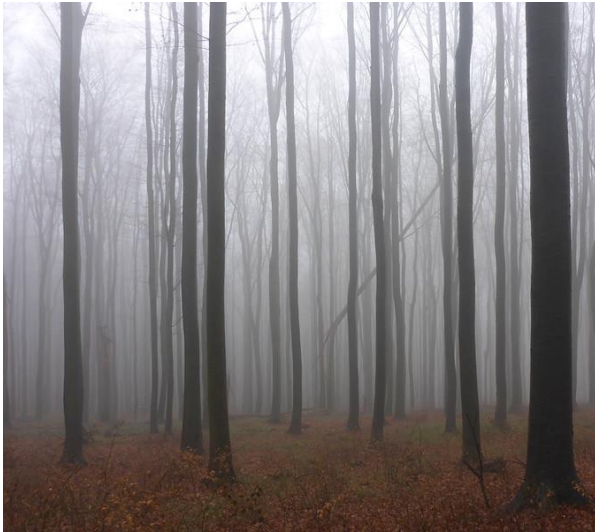
Abbildung 8: Christine Schmitt / Flickr