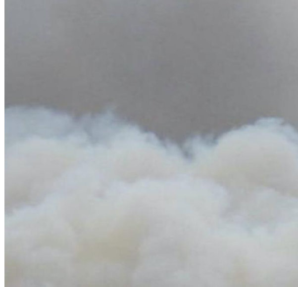
Abbildung 5: U.S. Department of Agriculture / Flickr