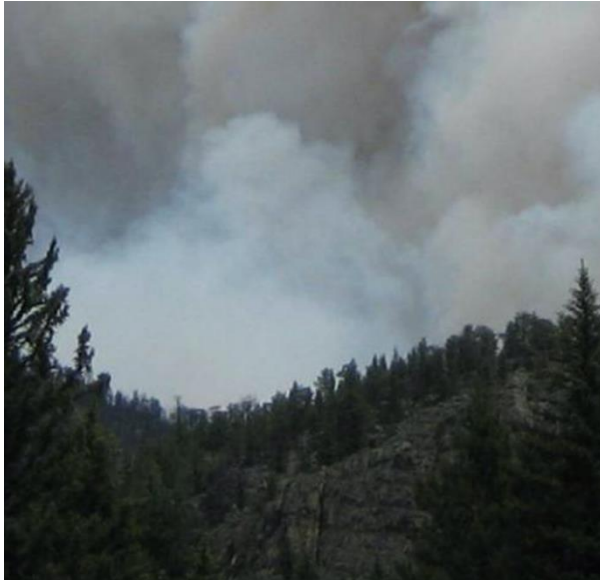
Abbildung 4:

Aufgabe 1: Bestimme bei den folgenden Bildern, ob es sich hierbei um den Rauch eines Waldbrands handelt, oder nicht. Mit welchen Dingen könnte der Rauch eines Waldbrandes verwechselt werden?