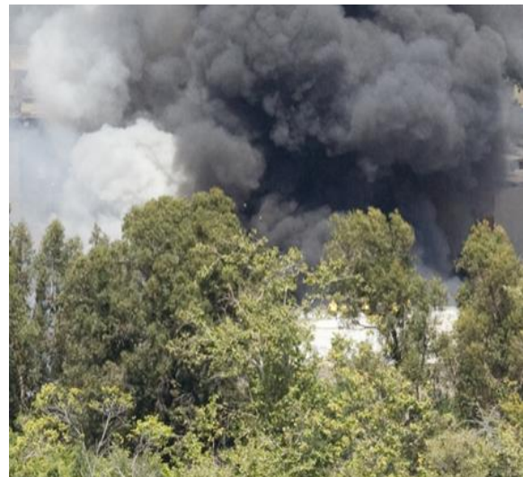
Abbildung 11: pinguino k / Flickr